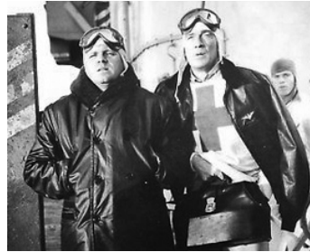
1954 ESCADRILLE PANTHÈRE (Men of the fighting Lady) d'Andrew Marton avec Wallace Ford