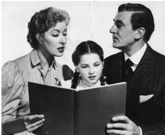
1952 VICKY (Scandal of Scourie) de Jean Negulesco avec Greer Garson, Donna Corcoran