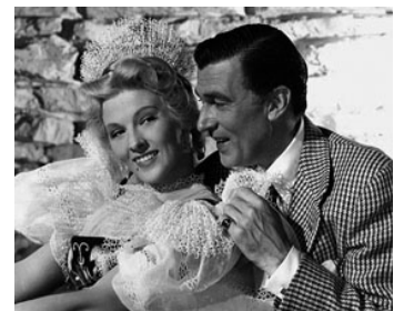
1946 FÉERIE À MEXICO (Holiday in Mexico) de George Sidney avec Ilona Massey