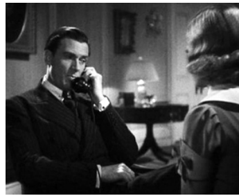
1936 EMPREINTES DIGITALES (Big Brown Eyes) de Raoul Walsh avec Joan Bennett