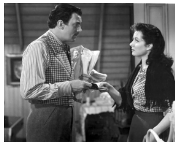
1944 MADAME PARKINGTON (Mrs Parkington) de Tay Garnett avec Greer Garson