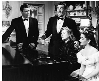
1948 LA BELLE IMPRUDENTE (Cass Timberlane) de G. Sidney avec P. Lawford, G. Garson, E. Taylor