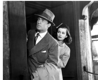
1941 CHASSE À L'HOMME (Man Hunt) de Fritz Lang avec Joan Bennett