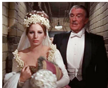
1968 FUNNY GIRL (Funny Girl) de William Wyler avec Barbra Streisand