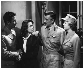
1949 LE DANUBE ROUGE (The red Danube) de G. Sidney avec P. Lawford, J. Leigh, A. Lansbury