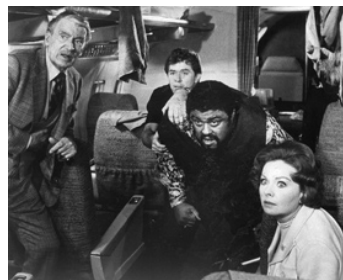
1972 ALERTE À LA BOMBE (Skyjacked) de John Guillermin avec R. Grier, Jeanne Crain