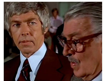
1973 HARRY GENTLEMAN PICKPOCKET (Harry in your Pocket) de Bruce Geller avec James Coburn