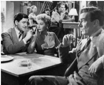
1951 CALLING BULLDOG DRUMMOND de Victor Saville avec Margaret Leighton