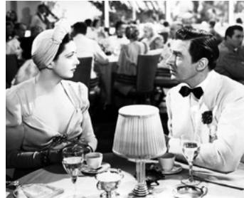
1940 LA DOUCE ILLUSION (It's a date) de William A. Seiter avec Kay Francis