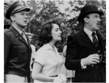
1954 LA DERNIÈRE FOIS QUE J'AI VU PARIS (The last time I saw Paris) de R. Brooks avec V. Johnson, E. Taylor