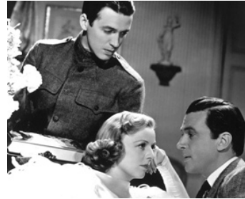
1938 L'ANGE IMPUR (The Shopworn Angel) de H. C. Potter avec James Stewart, Margaret Sullivan