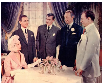
1954 AU FOND DE MON CŒUR (Deep in my Heart) de S. Donen avec M. Oberon, P. Henreid, J. Ferrer