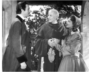
1938 LA BELLE CABARETIÈRE (Girl of the golden West) de Robert Z. Leonard avec J. Macdonald