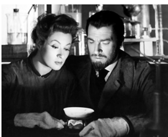
1943 MADAME CURIE (Madame Curie) de Mervyn LeRoy avec Greer Garson