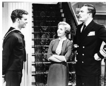
1955 LA FILLE DE L'AMIRAL (Hit the Deck) de Roy Rowland avec R. Tambllyn, Jane Powell