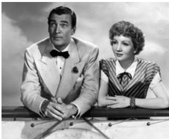
1946 CŒUR SECRET (The secret Heart) de Robert Z. Leonard avec Claudette Colbert