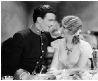
1930 NUITS VIENNOISES (Viennese nights) d'Alan Crosland avec Vivienne Segal