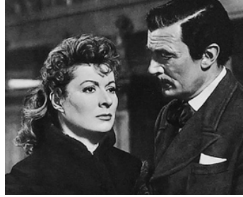
1949 LA DYNASTIE DES FORSYTHE (That Forsyte Woman) de C. Bennett avec G. Garson