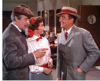
1952 LA PREMIÈRE SIRÈNE (Million Dollar Mermaid) de M. LeRoy avec Esther Williams, Victor Mature