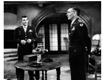
1948 TRAGIQUE DÉCISION (Command Decision) de Sam Wood avec Clark Gable