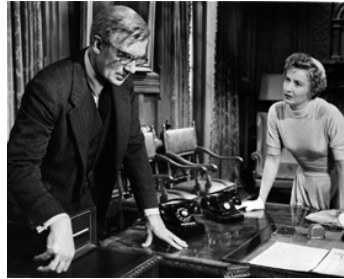
1954 LA TOUR DES AMBITIEUX (Executive suite) de Robert Wise avec Barbara Stanwyck