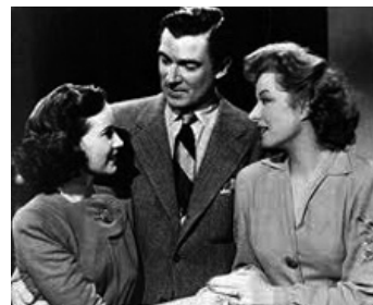
1942 MADAME MINNIVER (Mrs Minniver) de W. Wyler avec Teresa Wright, Greer Garson