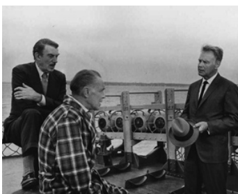
1962 TEMPÊTE SUR WASHINGTON (Advise and consent) d'Otto Preminger avec Lew Ayres