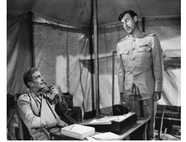
1951 TROIS TROUPIERS (Soldiers three) de Tay Garnett avec Stewart Granger