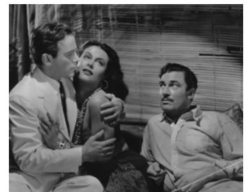
1942 TONDELAYO (White Cargo) de Richard Thorpe avec Richard Carlson, Hedy Lamarr