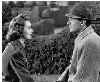
1947 QUAND VIENT L'HIVER (If Winter comes) de Victor Saville avec Deborah Kerr