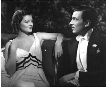
1937 MAN PROOF de Richard Thorpe avec Myrna Loy