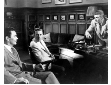
1952 LES ENSORCELÉS (The Bad and the Beautiful) de V. Minnelli avec Barry Sullivan, K. Douglas