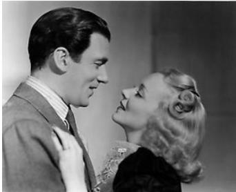
1939 TÉMOIN IMPRÉVU (Stronger than desire) de Leslie Fenton avec Virginia Bruce