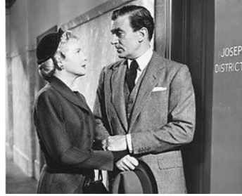
1951 LE DROIT DE TUER (The unknown Man) de Richard Thrope avec Anne Baxter