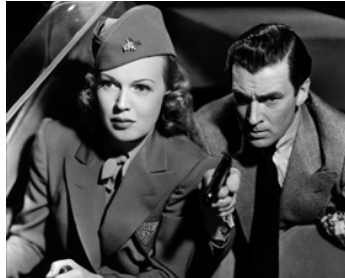
1939 NICK CARTER DÉTECTIVE (Nick Carter, master detective) de J. Tourneur avec Rita Johnson