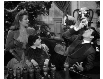
1941 LES OUBLIÉS (Blossoms in the Dust) de M.LeRoy avec Greer Garson, Richard Dixon