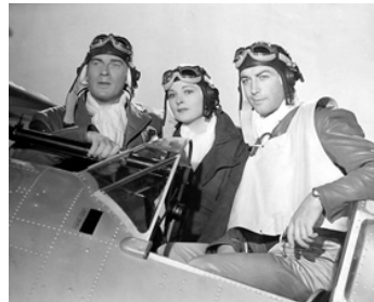
1940 L'APPEL DES AILES (Flight Command) de Frank Borzage avec Ruth Hussey, Robert Taylor