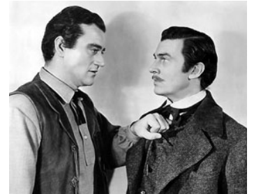
1940 L'ESCADRON NOIR (Dark Command) de Raoul Walsh avec John Wayne