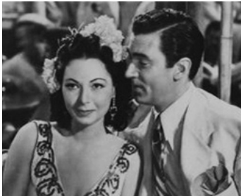
1940 NICK CARTER À PANAMA (Phantom raiders) de Jacques Tourneur avec Florence Rice