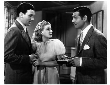
1937 SARATOGA (Saratoga) de Jack Conway avec Jean Harlow, Clark Gable