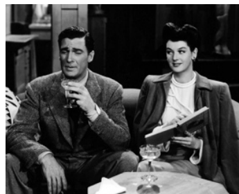
1941 ÉVITONS LE SCANDALE (Design for scandal) de Norman Taurog avec Rosalind Russell