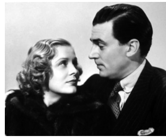
1936 GIRL OVERBOARD de Sidney Salkow avec Gloria Stuart