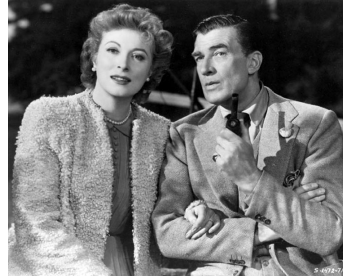
1950 L'HISTOIRE DES MINNIVER (The Minniver Story) de H. C. Potter avec Greer Garson