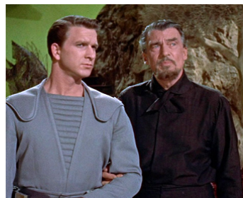
1956 LA PLANÈTE INTERDITE (The forbidden Planet) de Fred M. Wilcox avec Leslie Nielsen