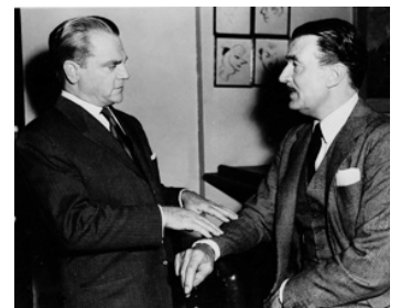
1956 PASSÉ PERDU (These wilder Years) de Roy Rowland avec James Cagney