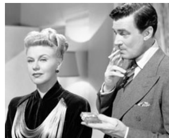
1945 WEEK-END AU WALDORF (Weekend at the Waldorf) de Robert Z. Leonard avec Ginger Rogers